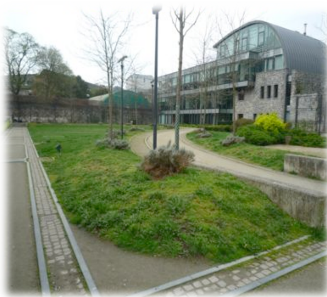
Parc de l'Etoile