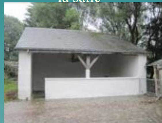
➤ Louftémont: restauration du lavoir et aménagement des abords