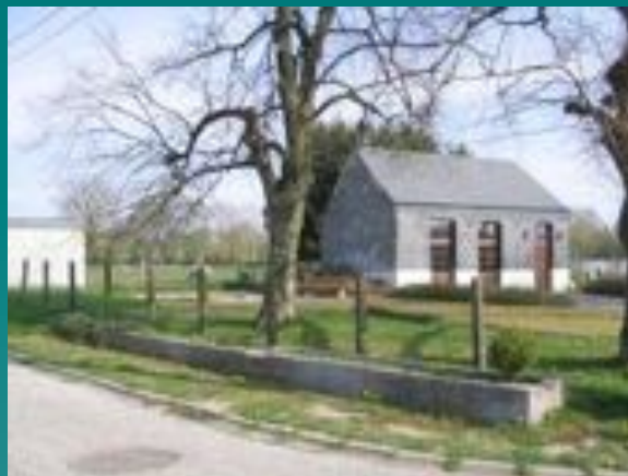
➤ Rancimont: aménagement des abords de la salle