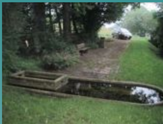
➤ Vlessart: aménagement du site de la source de Cherbuchy