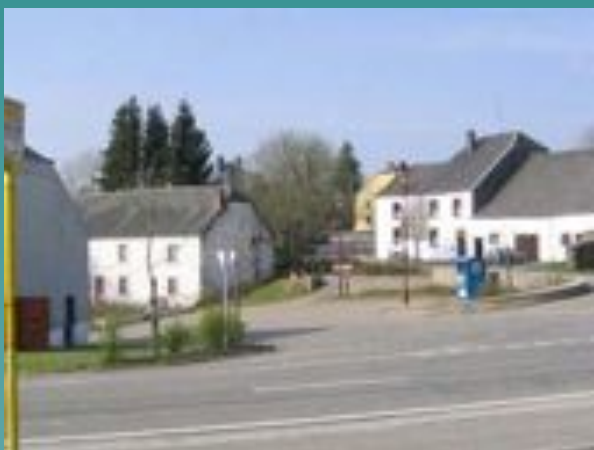
➤ Behême: aménagement de la placette au centre du village