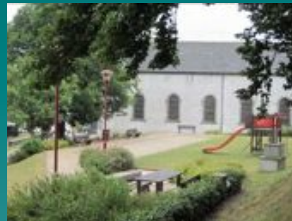
➤ Thibessart: aménagement d'une aire de détente aux abords de la salle