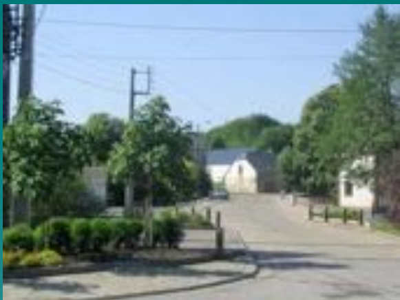
➤ Wittimont: aménagement du centre du village