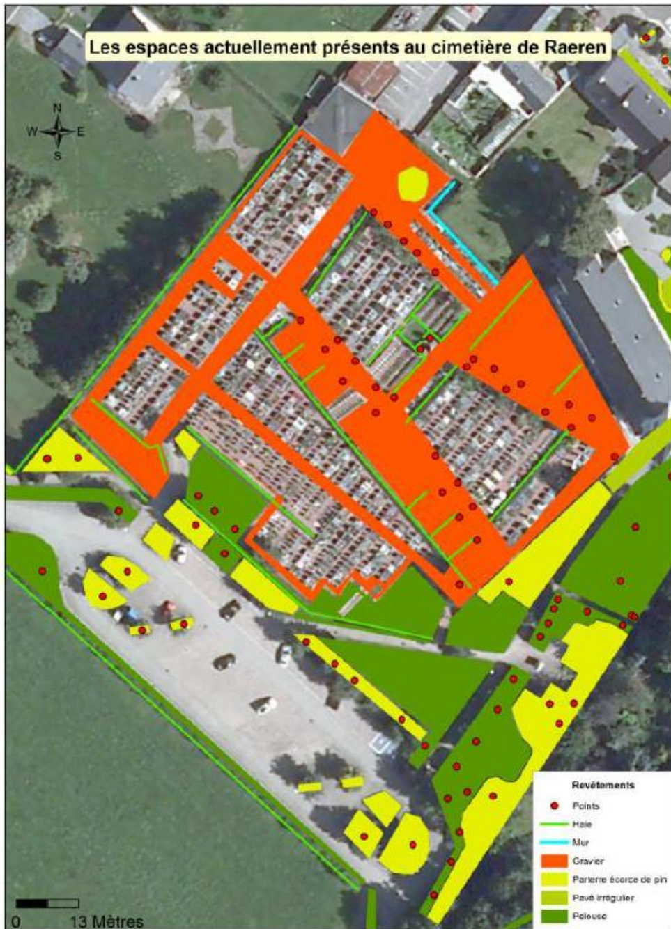
Les espaces actuellement présents au cimetière de Raeren