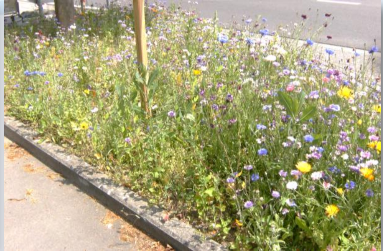
Prairies fleuries 2014 Bergstraße / Hauseter Straße