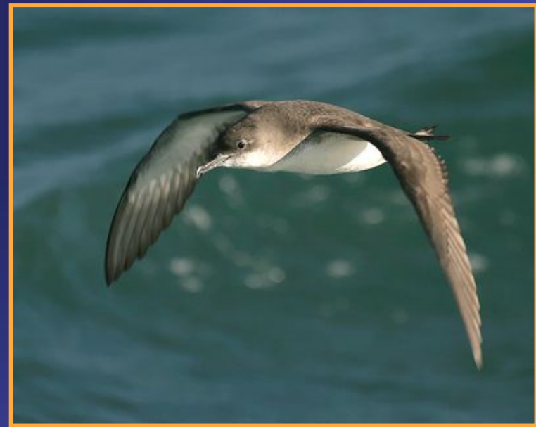
le Puffin de Méditerranée Puffinus yelkouan