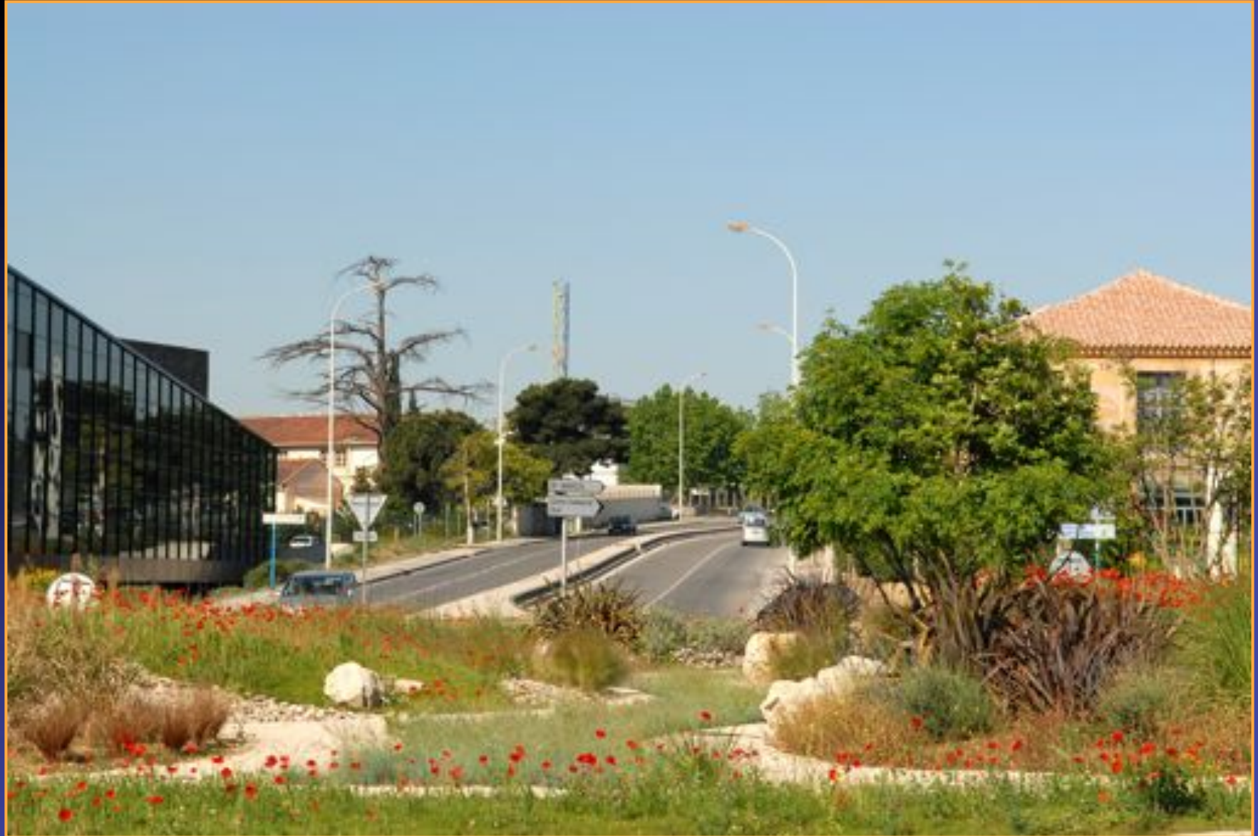
Rond-point Jean-Mondet (11e arr.)