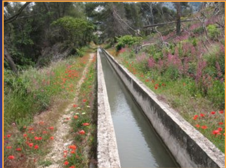
Canal de Marseille Quartier de Montredon (8e arr.)