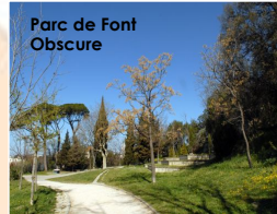
Parc de Font Obscure