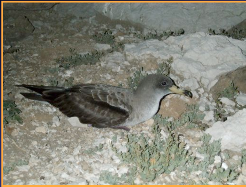
le Puffin cendré Calonectris diomedea

Trois espèces pélagiques ayant évolué dans la région méditerranéenne et ne nichant qu'en milieu strictement insulaire :