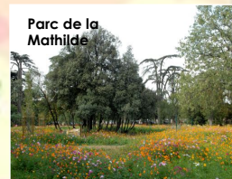
Parc de la Mathilde