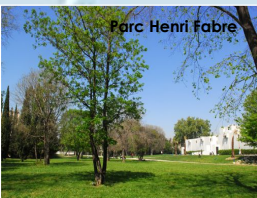
Parc Henri Fabre