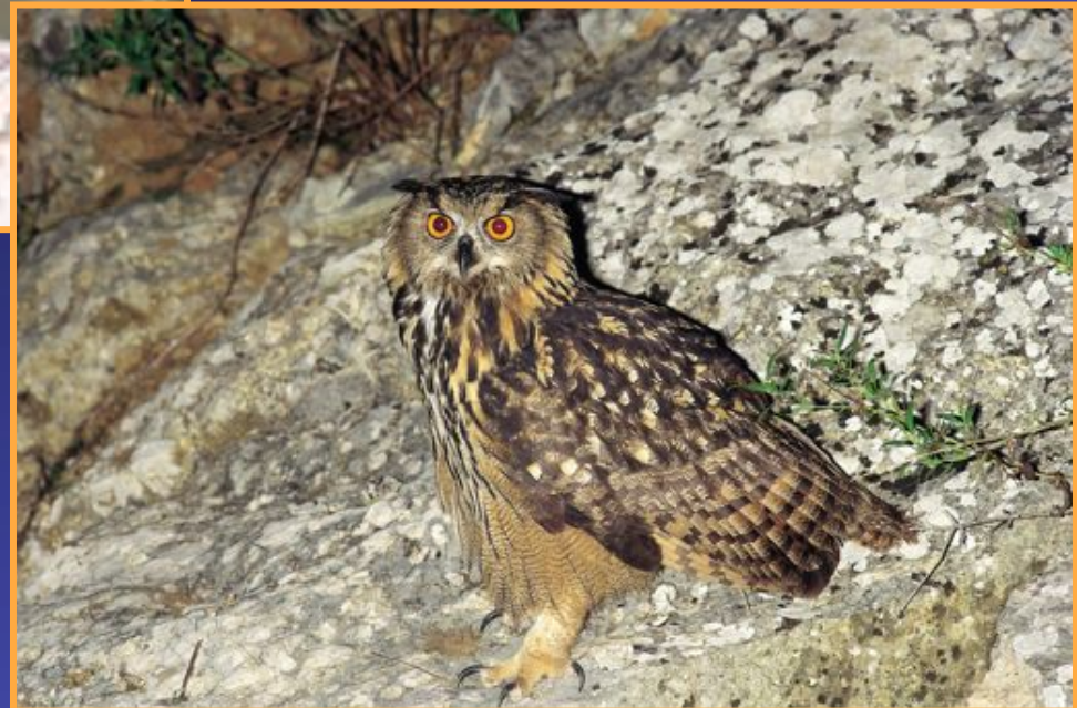
le Grand-duc d'Europe Bubo bubo