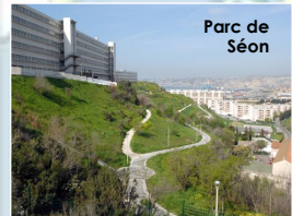
Parc de Séon