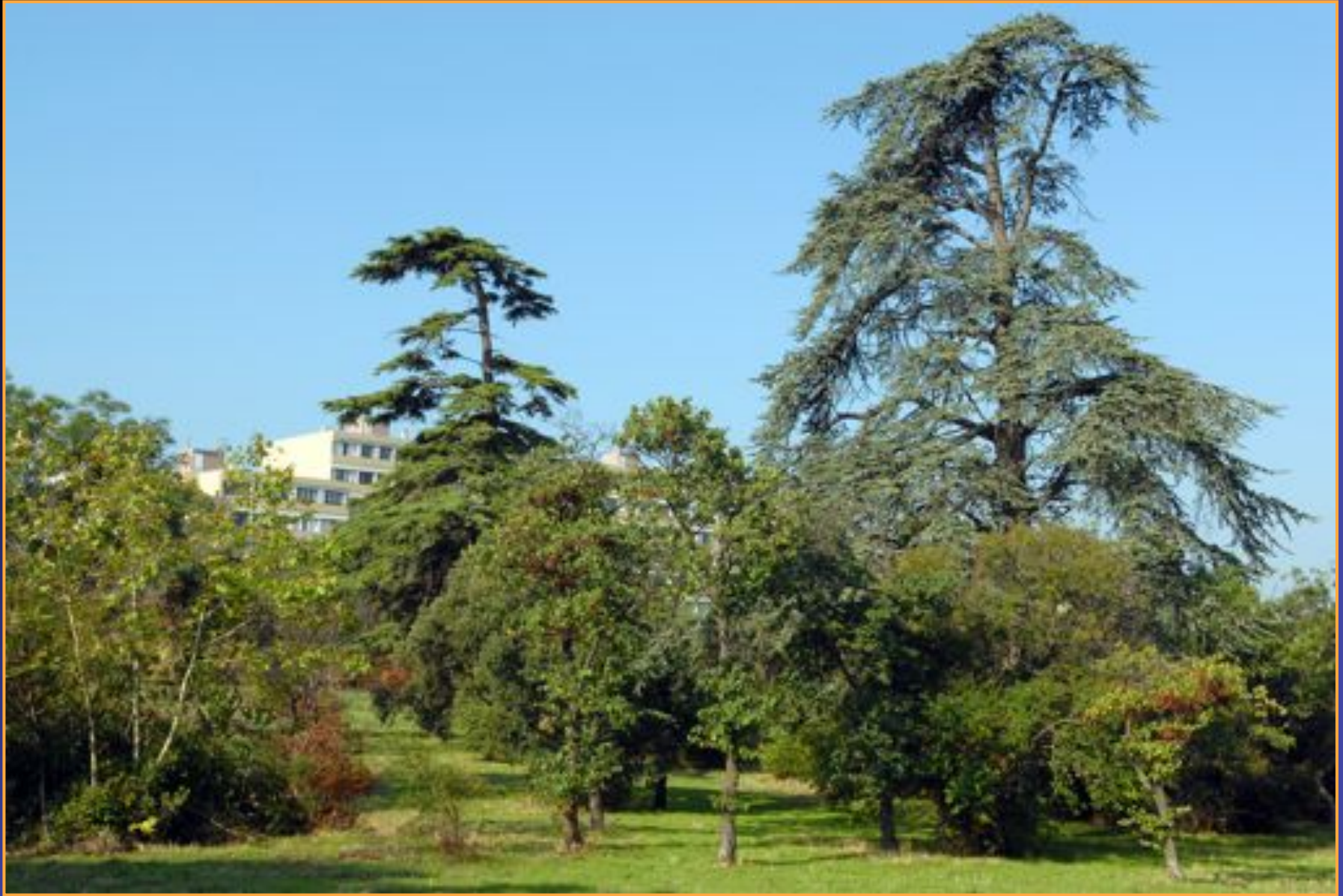
La Pintade (10e arr.)