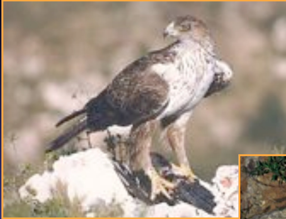
l'Aigle de Bonelli Aquila fasciata