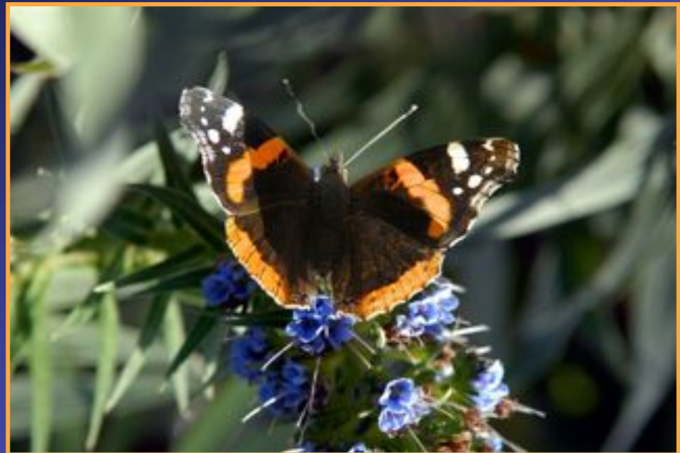
le Vulcain Vanessa atalanta