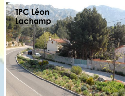
TPC Léon Lachamp