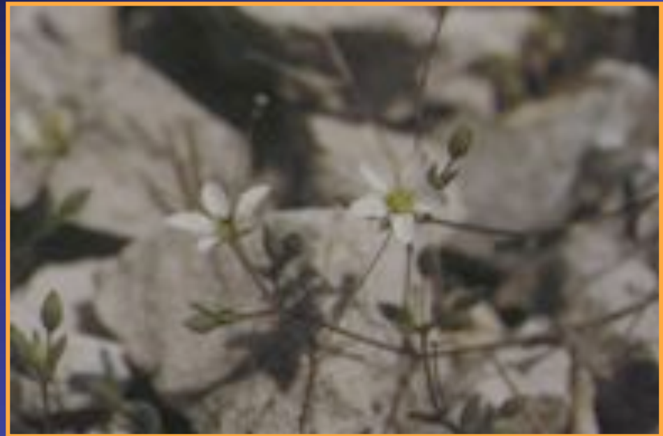
la Sabline de Provence ( Gouffeia arenarioides )