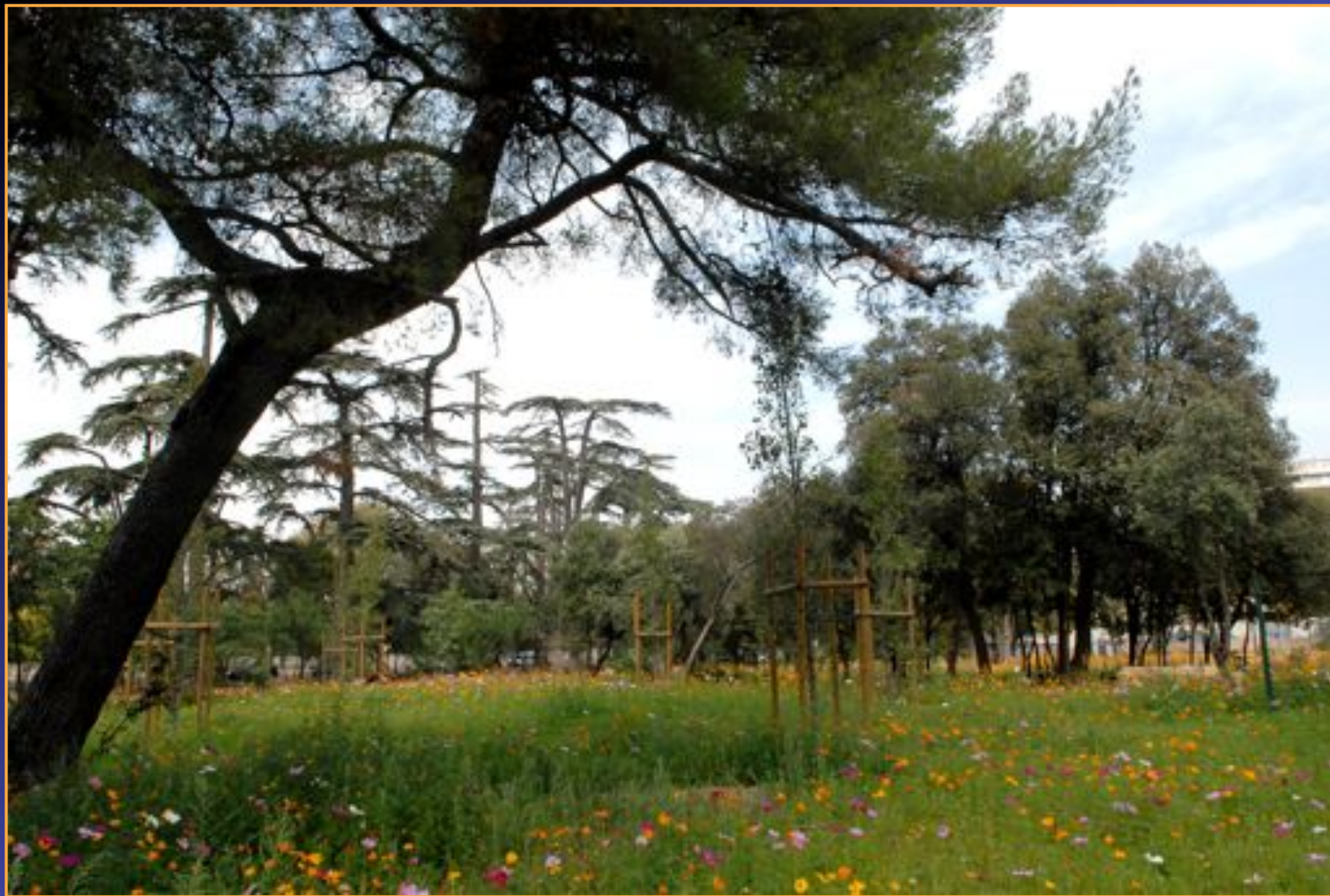
La Mathilde (8e arr.)