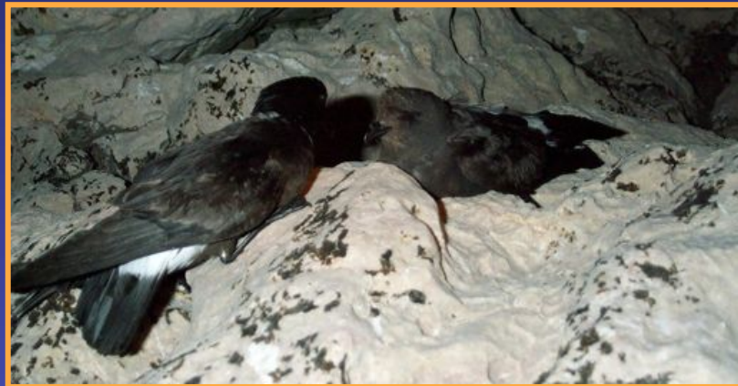
l'Océanite tempête Oceanites pelagicus