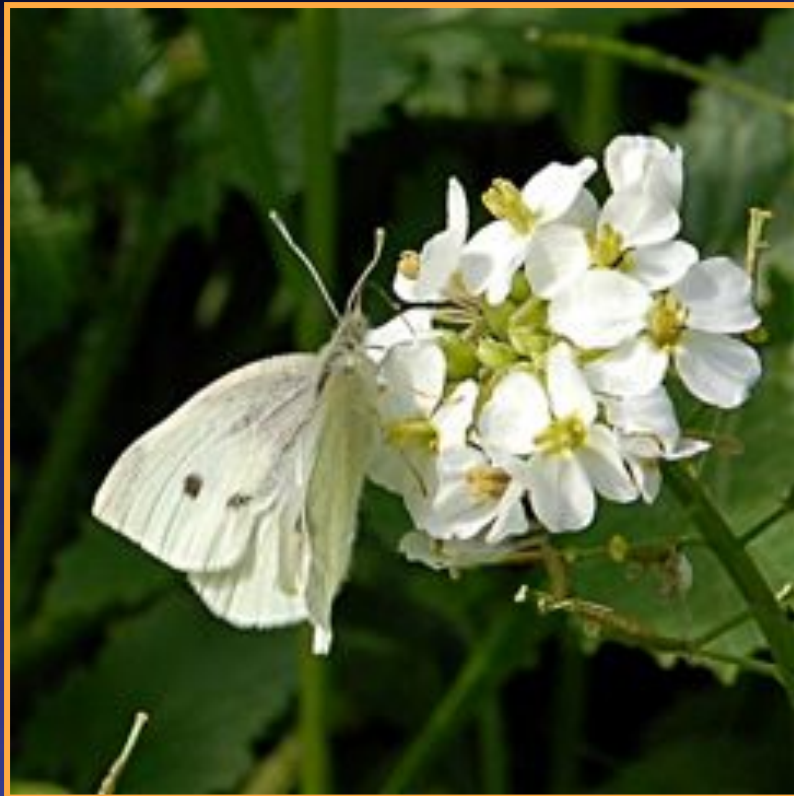
la Piéride de la rave Pieris rapae

Exemples de papillons de jour présents dans les parcs de Marseille :