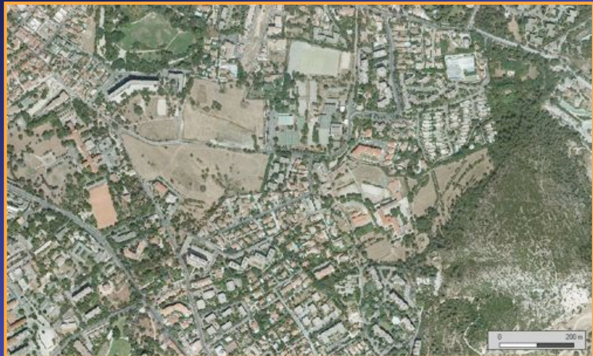
Quartier Ste.-Marguerite (9e arr.)