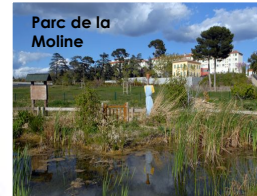
Parc de la Moline