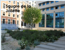
Square de la Joliette